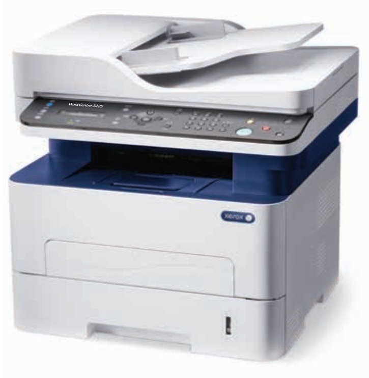
WorkCentre 3225. Kopyalama. Yazdırma. Tarama. Faks. E-posta.