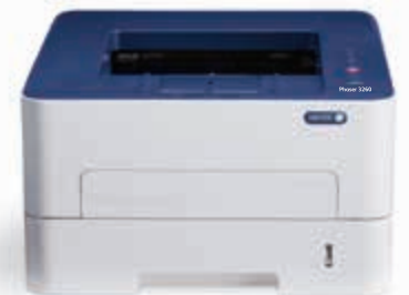
Phaser 3260. Yazıcı.